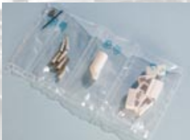
Kammersystem mit Schweißnaht-Verbund