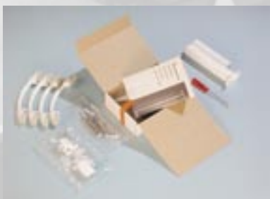
Kartonverpackung mit individueller Ausstattung