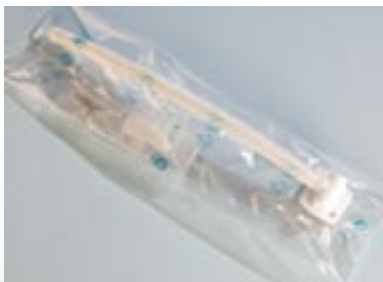
Schlauchverpackung mit Schweißnaht-Verbund