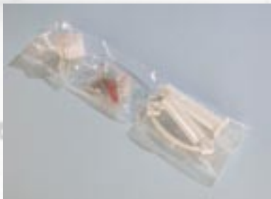
Mehrzonen-Schlauchverpackung mit Schweißnaht-Verbund